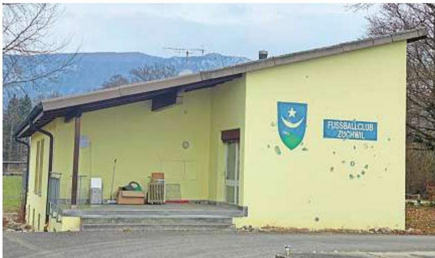
Mit Hilfe der Gemeinde, die sich mit rund 100 000 Franken beteiligt, sollen bis zur Eröffnung auch noch Heizung und die sanitären Anlagen ersetzt werden. Zudem werden noch die Fassade und das Türsystem renoviert.

Im alten Klubhaus des FC Zuchwil entsteht derzeit der Widitreff. Die Renovation des neuen Zuchwiler Treffpunkts schreitet voran. Auch die Gemeinde beteiligt sich mit 100 000 Franken an der guten Sache.