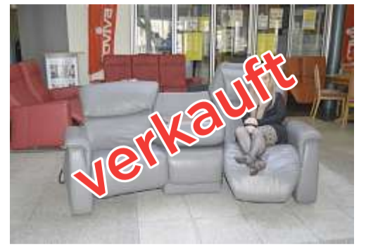
CHF 2'990.- statt 8'290.-, Second Hand elektrisches Leder-Trapez-Sofa

Entdecken Sie weitere tolle Angebote in unserer Ausstellung!