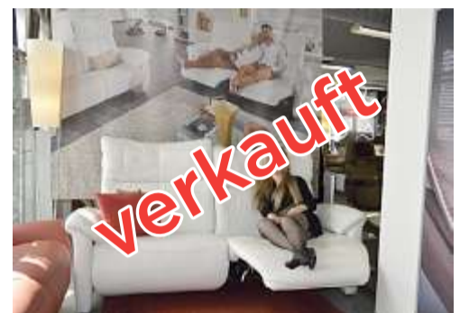
CHF 3'390.- statt 6'780.-, Wallfree Dickleder 3er Sofa mit 2 Relax-Funktionen