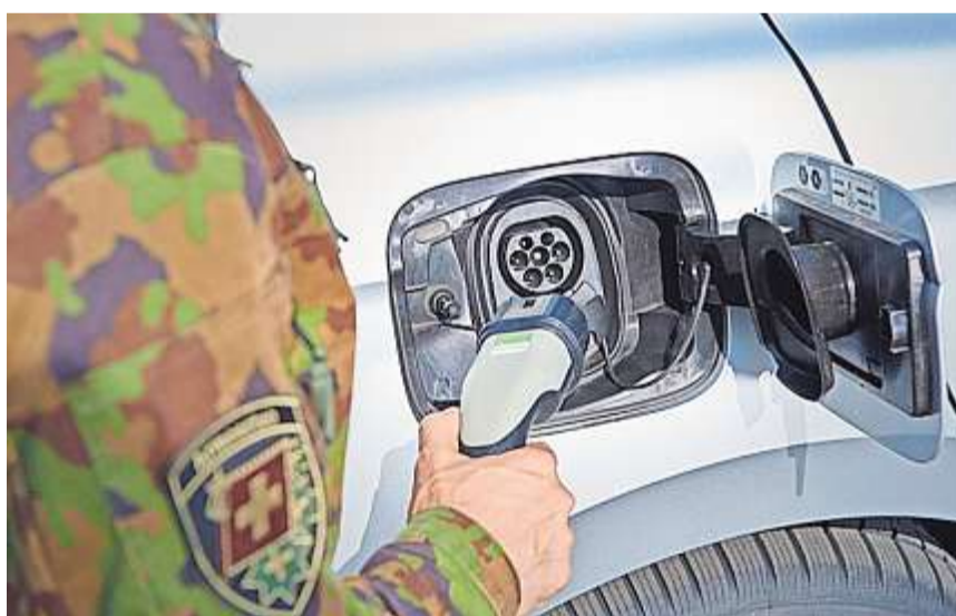
Die Logistikbasis der Armee in den letzten drei Jahren (2020-2022) ein Pilotprojekt mit Elektrofahrzeugen durch, an dem rund 143 Berufsmilitärs freiwillig teilnahmen.

In diesem Zusammenhang führte die Logistikbasis der Armee (LBA) in den