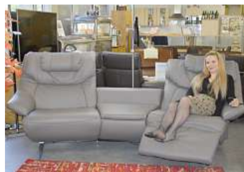
CHF 5'495.- statt 10'990.-, Trapez-Sofa Dickleder mit 2 el. Relax-Funktionen usw.