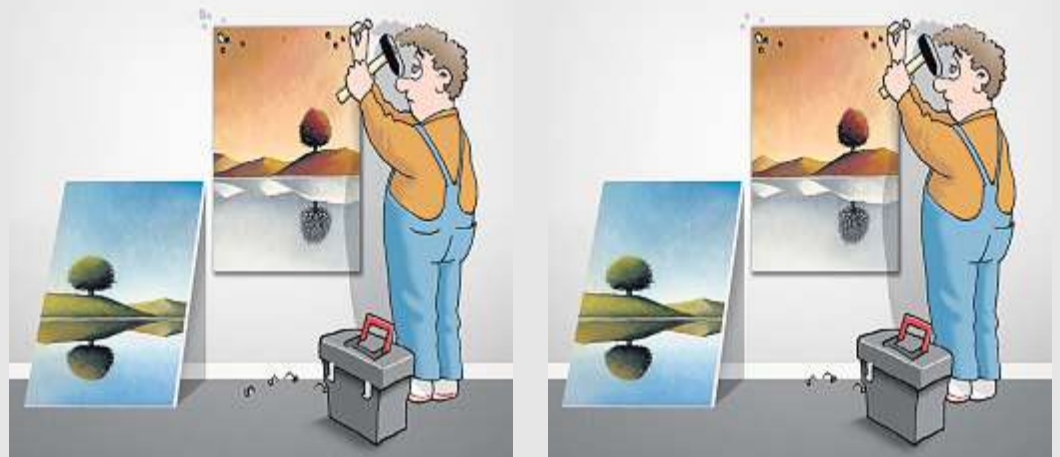
Auf den ersten Blick sehen beide Bilder gleich aus. Sie unterscheiden sich aber in acht Einzelheiten. Wo sind diese zu finden?

Widder 21.3. – 20.4. Bestimmte Zeiten sind nun endgültig vorüber, und das ist auch gut so. Lange Zeit sahen Sie vieles zu verklärt und mit einer Art rosaroter Brille. Das Jammern anderer sollte Sie kaltlassen!