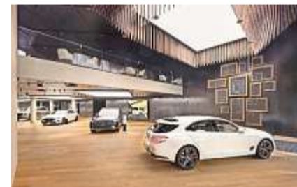
Edle Autos müssen auch in entsprechendem Rahmen gezeigt werden – wie die Genesis-Modelle an der Zürcher Bahnhofstrasse.