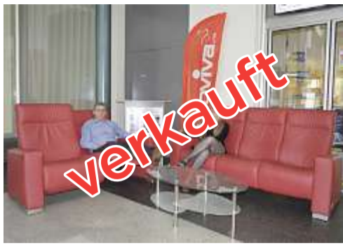
CHF 5'490.- statt 10'980.- 3er + 2½ Leder-Sofa mit 2 Relax-Funktionen

Gönnen Sie sich jetzt, was Sie sich schon immer leisten wollten. Mit 50-80% Rabatt! SPEZ. BEZ. WOHLFÜHL-POLSTER-GARNITUREN, RELAX-SESSEL, SIDEBARDS, TISCHE, STÜHLE, TEPPICHE USW.