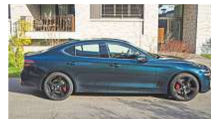
Die Seitenlinie des 4,69 Meter langen G70 zieht sich schnörkellos nach hinten, wo das wuchtige Heck mit kleinem Bürzel an der Heckklappe ausläuft.