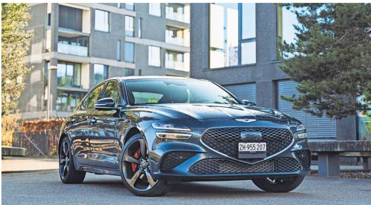
Um der hiesigen anspruchsvollen Kundschaft zu gefallen, ist der G70 voll auf den Geschmack der Europäer getrimmt.

Im Innenraum wirkt der G70 dank grosser Lederflächen, toll verarbeiteten Sitzen mit Rautensteppung und feiner Materialauswahl fast eine Klasse höher.