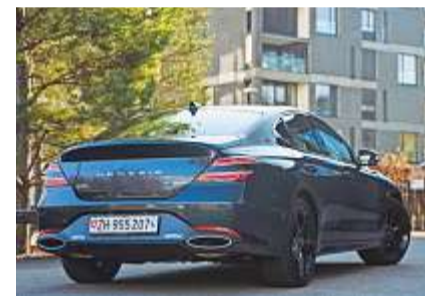
Die wuchtigen Endrohre untermauern die Sportlichkeit.

Motor: 2-Liter-Vierzylinder Turbobenziner: 1998 ccm Antrieb: Hinterrad / 8-Gang-Automatik Leistung: 245 PS max. Drehmoment: 353 Newtonmeter – 0 bis 100 km/h: 6,1 s Höchstgeschwindigkeit: 240 km/h Verbrauch: 8.0 Liter (Test 8.9 Liter) Reichweite: ca. 630 km Masse: Länge x Breite x Höhe 4685 mm x 1850 mm x 1400 mm. Leergewicht: 1675 kg/Zuladung 465 kg Kofferraum normal: 330 l Anhängelast: geb./ungeb. 1500 kg/750 kg Garantie: 5 Jahre Preis: ab CHF 46 200.– (mit Allrad ab ca. CHF 54 000.–) Internet: genesis.com