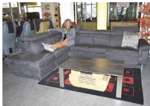
CHF 4'245.- statt 8'490.-, Polster-Garnitur, Mikrofaser, mit 1 el. Relax-Funktion usw.