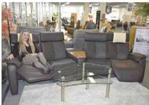
CHF 6'890.- statt 13'790.-, Home Cinema, Dickleder, 4 Relax-Funktionen + Trapez Tisch